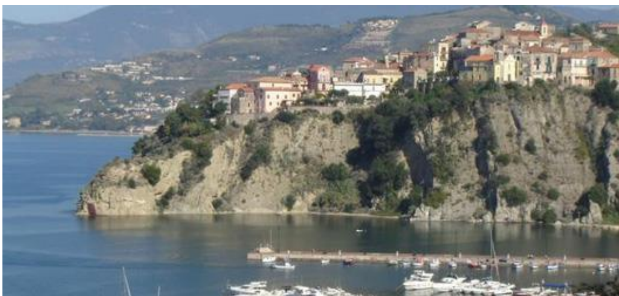
Campo di Regata: Agropoli, specchio d'acqua porto