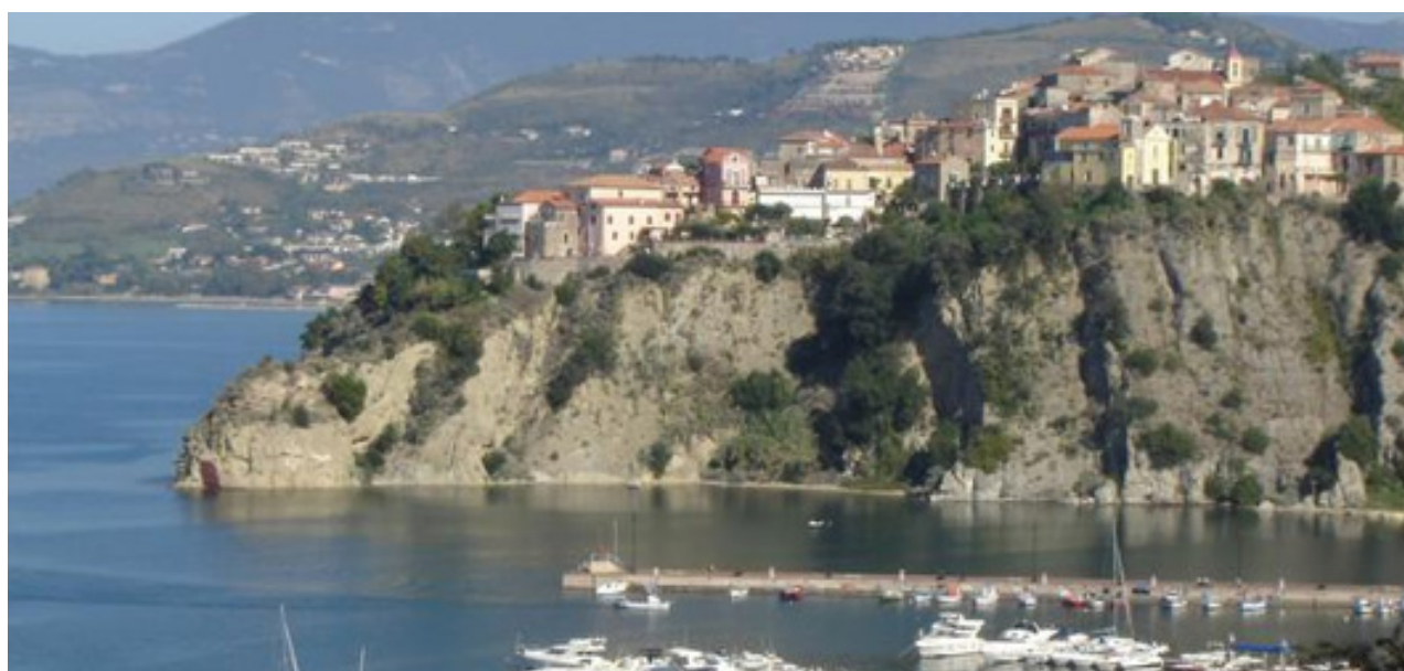
Campo di Regata: Agropoli, specchio d'acqua porto